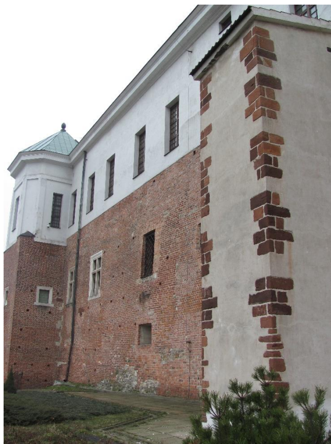
Zdj. 2 Elewacja zachodnia