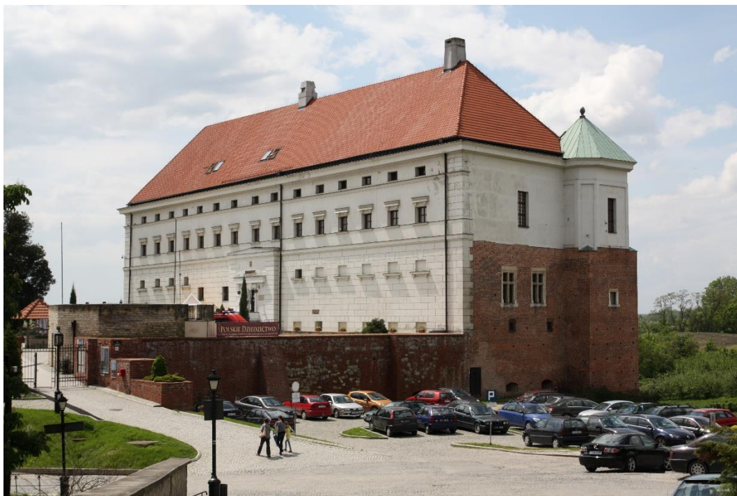
Zdj. 1. Zamek, parking.