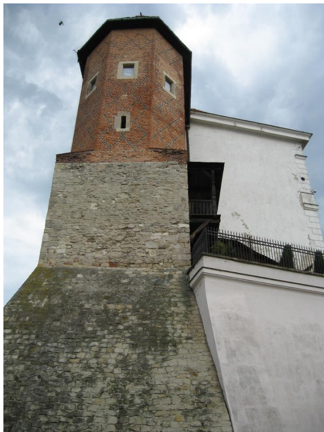
Zdj. 3 Baszta południowa, schody drewniane.