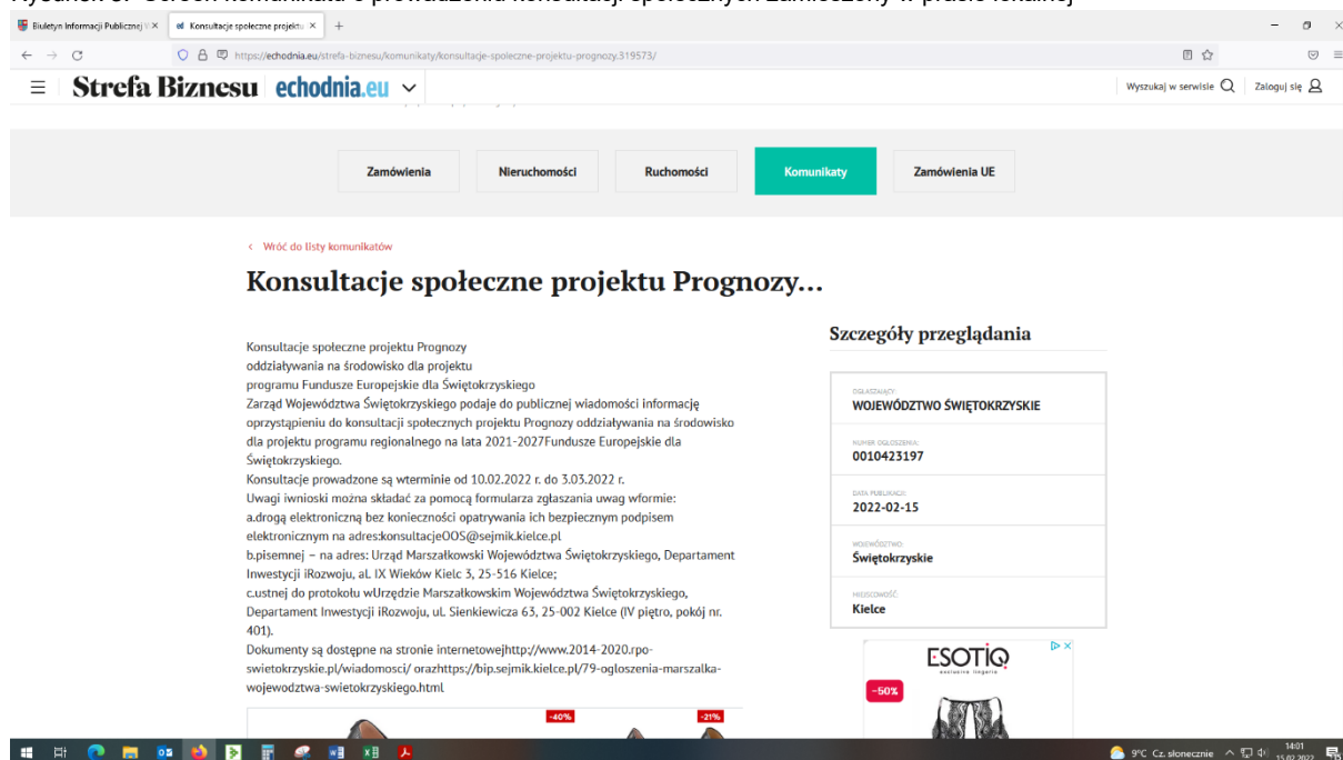
Rysunek 3. Screen komunikatu o prowadzeniu konsultacji społecznych zamieszczony w prasie lokalnej