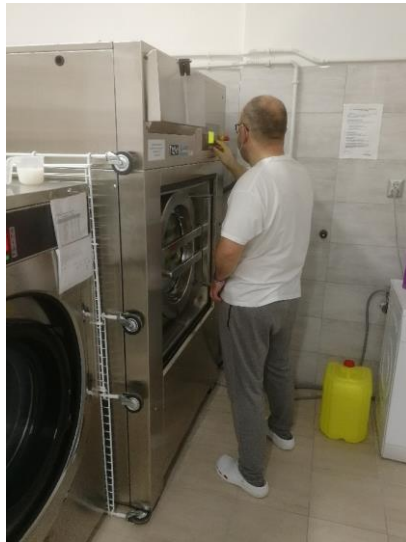
Pralnia prowadzona przez Zakład Aktywności Zawodowej w Kielcach prowadzony przez Stowarzyszenie „Nadzieja Rodzinie”