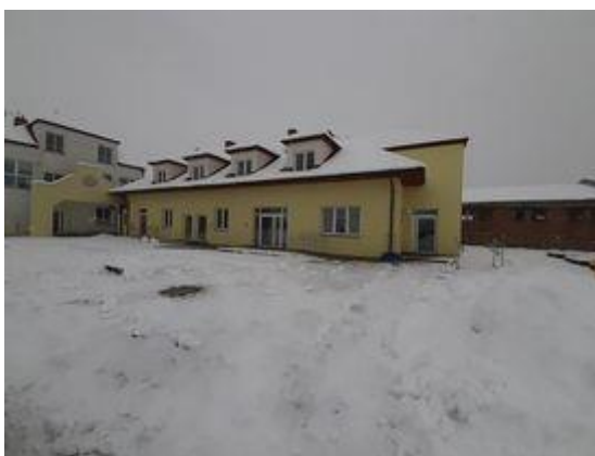
Nowoutworzony Zakład Aktywności Zawodowej w Sandomierzu, którego Organizatorem jest Caritas Diecezji Sandomierskiej

Według stanu na grudzień 2020 r. w sześciu Zakładach Aktywności Zawodowej zatrudnionych było łącznie 325 osób, w tym 242 osoby z niepełnosprawnościami w tym: