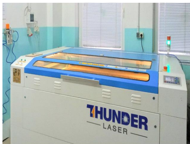
Laser zakupiony przez Zakład Aktywności Zawodowej w Końskich