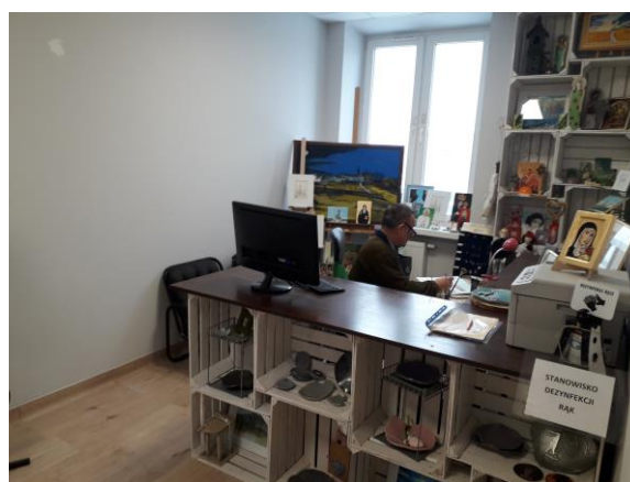
Pracownia rękodzielnicza w Zakładzie Aktywności Zawodowej w Kielcach prowadzonym przez Stowarzyszenie „Nadzieja Rodzinie”