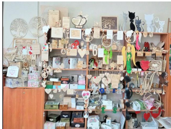
Rękodzieło wykonane przez pracowników Zakładu Aktywności Zawodowej w Końskich