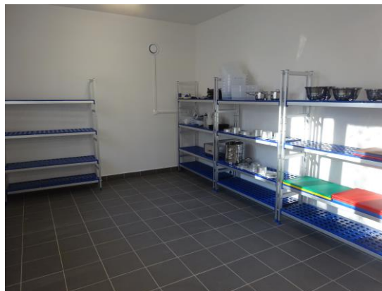
Pracownia gastronomiczna w nowoutworzonym Zakładzie Aktywności Zawodowej w Kielcach, którego Organizatorem jest Fundacja Gramy z Tobą