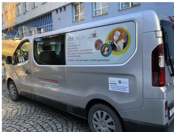
Samochód zakupiony przez Zakład Aktywności Zawodowej w Kielcach prowadzony przez Caritas Diecezji Kieleckiej