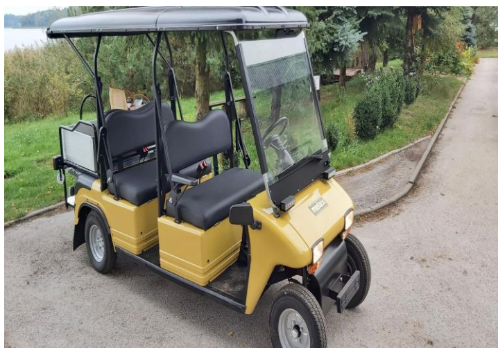
Wózek transportowy z napędem elektrycznym .zakupiony przez Zakład Aktywności Zawodowej w Stykowie