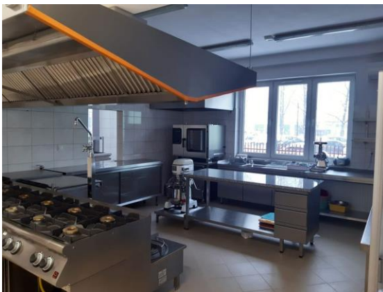
Pracownia gastronomiczna w nowoutworzonym Zakładzie Aktywności Zawodowej w Sandomierzu, którego Organizatorem jest Caritas Diecezji Sandomierskiej