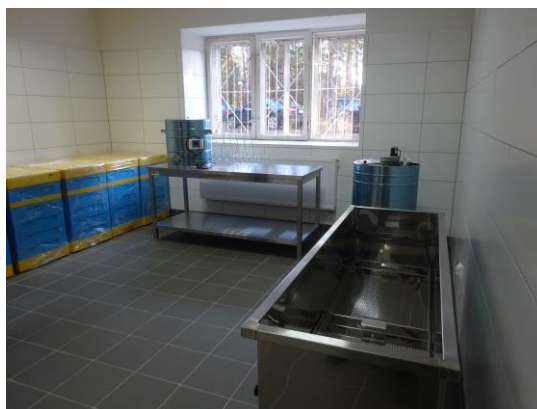
Pracownia pszczelarska w nowoutworzonym Zakładzie Aktywności Zawodowej w Kielcach, którego Organizatorem jest Fundacja Gramy z Tobą