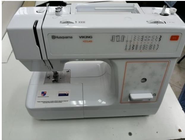
Maszyna do szycia zakupiona przez Zakład Aktywności Zawodowej w Strykowie