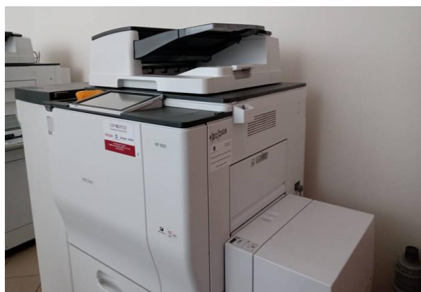
Drukarka zakupiona przez Zakład Aktywności Zawodowej w Kielcach prowadzony przez Caritas Diecezji Kieleckiej