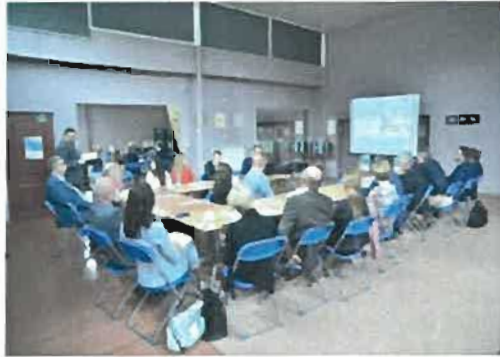
PHOTO: meetings of the Regional Group of Stakeholders in the Świętokrzyskie Province.