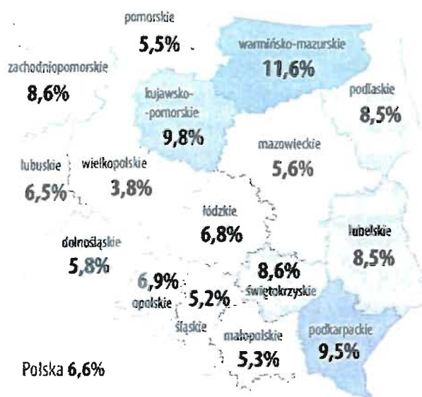
Stopa bezrobocia rejestrowanego stan w końcu października 2017 r.

Stopa bezrobocia rejestrowanego w okresie ostatnich lat spadała zarówno w kraju jak i w województwie. W 2017 roku osiągnęła w świętokrzyskim 8,6 % , dla porównania w kraju 6,6% . Pomimo odnotowanych spadków stopy bezrobocia sytuacja bezrobotnych w województwie należy do najgorszych w kraju (gorszy wskaźnik charakteryzował tylko województwa: warmińsko- mazurskie - 11,6 % , kujawsko-pomorskie - 9,8 % i podkarpackie - 9,5 % ).