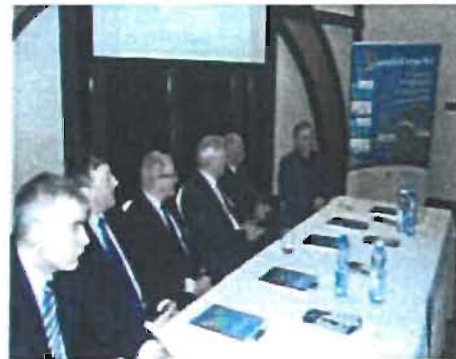
Zdjęcia: spotkania Regionalnej Grupy Interesariuszy w województwie świętokrzyskim