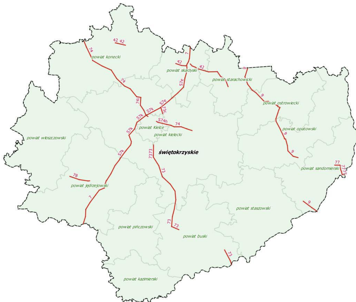
Rys. 2.2. Przebieg analizowanych odcinków dróg krajowych w województwie świętokrzyskim o ruchu powyżej 3 000 000 pojazdów rocznie objętych opracowaniem map akustycznych wykonanych w 2018 r. [30]