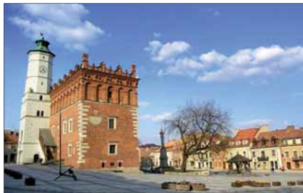
Ratusz i rynek w Sandomierzu.

– Dodatkowa pomoc dla województwa wiąże się z uruchomianym centralnym programem wsparcia dla Polski Wschodniej. Jak znacząca będzie ta pomoc?