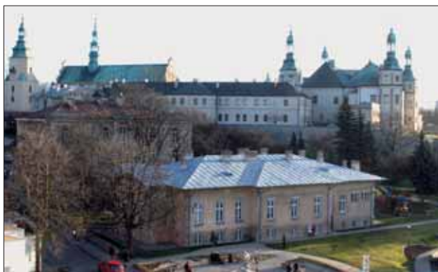
Kielce. Widok na pałac biskupów krakowskich i katedrę.