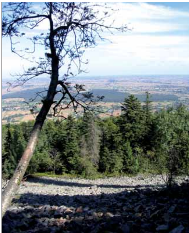
Świętokrzyski Park Narodowy.

Drugą z rozwojowych funkcji regionu jest przemysł wydobywczy – filar gospodarki regionu, przeżywający obecnie okres prosperity. Ze 126 udokumentowanych złóż surowców mine-