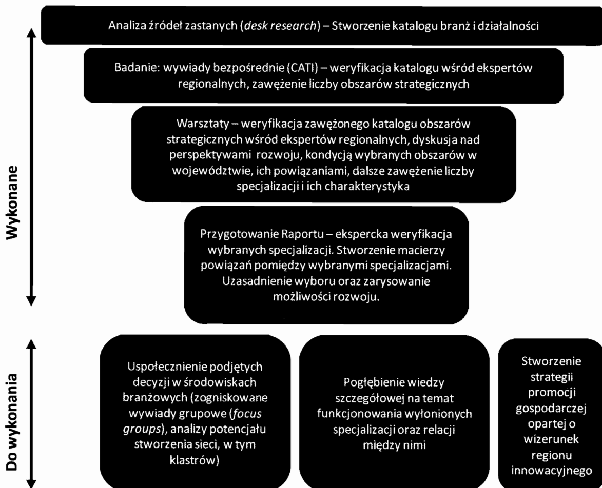
Rysunek 1. Schemat procesu badawczego

Pożądanym jest również wsparcie działań podejmowanych wewnątrz województwa przez ukierunkowane działania na zewnątrz – wspólna promocja administracji, biznesu i nauki. Promocja gospodarcza powinna również zostać zaplanowana na podstawie szczegółowo przeprowadzonej diagnozy oraz prowadzona według wypracowanej strategii, opierającej się o ideę regionu innowacyjnego..