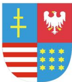
Zarząd Województwa Świętokrzyskiego