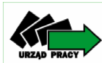
Wojewódzki Urząd Pracy w Kielcach