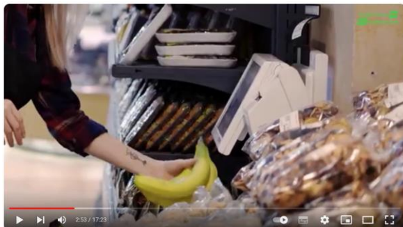
Razem tworzyMY EKOświętokrzyskie_film edukacyjny_młodzież_Urząd Marszałkowski woj. świętokrzyskiego

„Warto wybierać towary kupowane na wagę, rezygnując z produktów pakowanych w kilka warstw opakowań”.