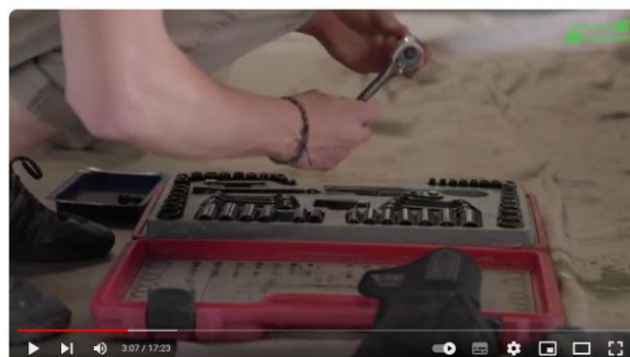
Razem tworzyMY EKOświętokrzyskie_film edukacyjny_młodzież_Urząd Marszałkowski woj. świętokrzyskiego

„Naprawiaj przedmioty, zamiast kupować nowych”.