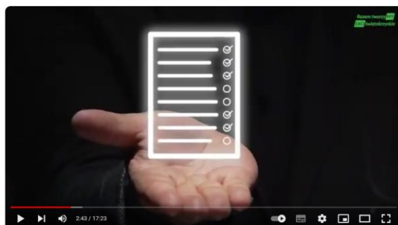
Razem tworzyMY EKOświętokrzyskie_film edukacyjny_młodzież_Urząd Marszałkowski woj. świętokrzyskiego

„Na zakupy zabieraj przygotowaną wcześniej listę zakupów, aby uniknąć kupowania zbędnych rzeczy i zapobiegać marnowaniu żywności”.