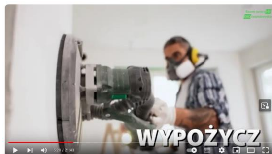
Razem tworzyMY EKOświętokrzyskie_film edukacyjny_mieszkańcy_1

„Wypożyczaj sprzęty rzadko używane zamiast ich kupować”.