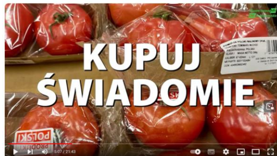
Razem tworzyMY EKOświętokrzyskie_film edukacyjny_mieszkańcy_1

„Na zakupy zawsze zabieraj torbę wielokrotnego użytku”.