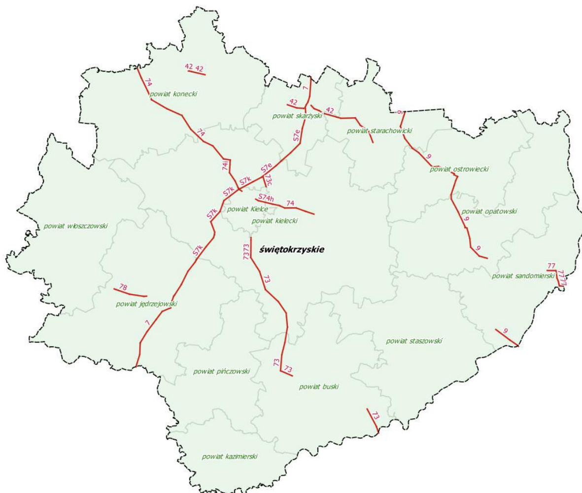
Rys. 2.2. Przebieg analizowanych odcinków dróg krajowych w województwie świętokrzyskim o ruchu powyżej 3 000 000 pojazdów rocznie objętych opracowaniem map akustycznych wykonanych w 2018 r. [30]